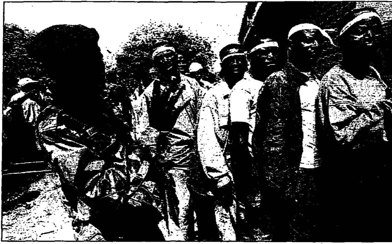
جنود حكوميين في ملابس مدنية يمشون لتسجيل استقامتهم في مكتب للمتمردين في كينشاسا

بات الحياة تعود لطبيعتها ببطء في كينشاسا العاصمة وزائير ما بعد موبوتو. عمل بعد الاطاحة بالديكتاتور موبوتو سيسي سيكو. وفي اول تصوير مهم من لشدة في الزعيم الزائيري الجديد لوران كابيلا زادت قيمة زائير ما بعد موبوتو من اثنين اسم الدول. وقال سيسي سيكو ان الزعيم الجديد سيؤيد 78 ألف زائير بالقرابة مع 188 ألف زائير الاسود الكونغولي.